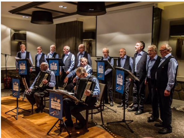
ongeregeld koor Sint Bacchus uit Zeijen